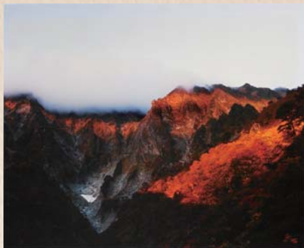
「寸光一の倉沢」 谷川岳

一年前から酸素が必要となり、遠出が思うようにできなくなってきました。最近赤城山にレンゲツツジの撮影に出かけたとき、東屋