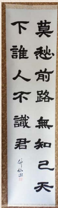
書道は師範の腕前です