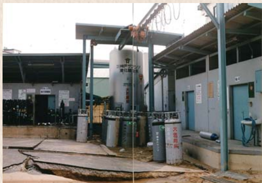
阪神・淡路大震災で被災した工場 平成七年一月

(株)マルホン様とは、共にHOT事業を行う同志として、『いつもホンネで語りあえる』お付き合いをさせていただいております。これからもお互いに切磋琢磨し、HOT事業の発展に尽力したいと思います。