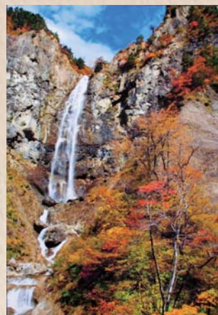
「ふくべの大滝」 白山スーパー林道

それ以来、いろいろな場面でも堂々と酸素と仲良く付き合っているようになりました。これからも酸素を背負いながら撮影会に参加したり、畑に出たりして、プラス思考でいこうと思います。