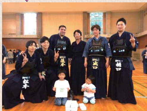
神戸市民剣道大会で大活躍！

部は全国大会へ出場するなど、ちょっとだけ(?)活躍しています!(…良かったら応援して下さい!!)