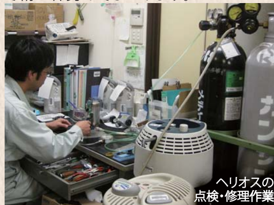
ヘリオスの 点検・修理作業

これからも「 機器の向こうに患者さまがいる 」を合い言葉に、確実な管理を目指して精一杯努めてまいります。