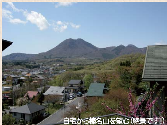
自宅から榛名山を望む(絶景です!)

そんな私が渋川に越してきて丸10年になります。近くに温泉があり、取れたて野菜が美味しく、空気が良く…。大変気に入っていました。