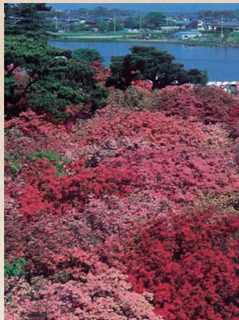
満園紅に染まる花の海

ツツジは歴代の館林城主や愛好家、また自治体によって手厚い保護と育成が図られ、樹齢 800 年を超える高さ 5m のヤマツツジ(左上)や、新田義貞の妻「勾当の内侍(こうとうのないし)」遺愛のツツジなど、今では古木名木 50 品種以上約 10,000 株のツツジが植栽されています。昭和 9 年 12 月 28 日には国の名勝に指定されました。