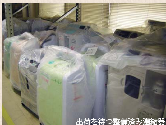
出荷を待つ整備済み濃縮器

ご使用者さまと取扱機器の増加に伴い、現在、ここでの仕事量はほぼ飽和に達してしまいました。そこで太田営業所